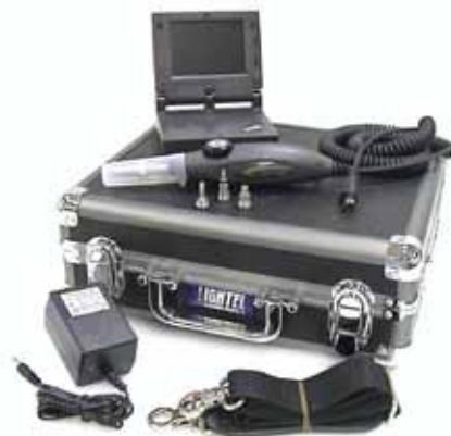
TSO-VIM-1100 LCD Komplettkit