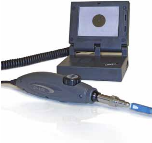
Betrachtung eines SC Steckers mit dem TSO-VIM-1100