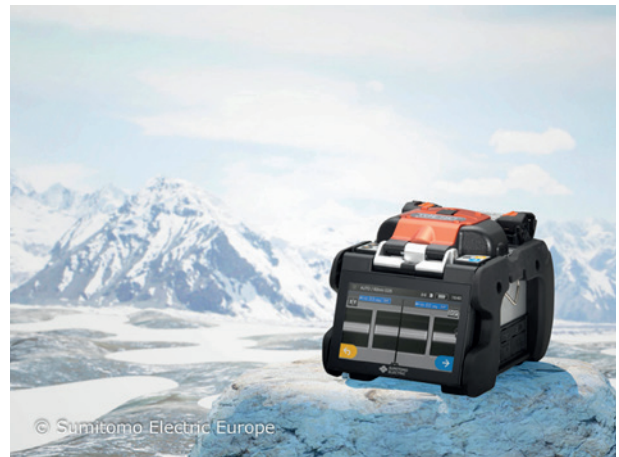
T-72C+ - verlässlich auch unter extremen Bedingungen