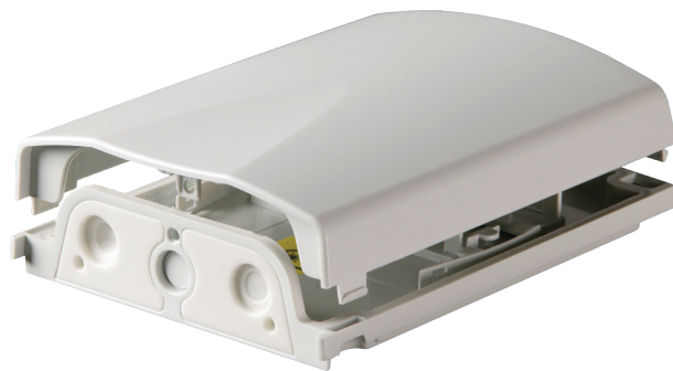
OTB12 Verteiler mit Abdeckung

Auf Wunsch liefern wir den OTB12 Verteiler komplett spleißfertig vormontiert mit Kupplungen, Pigtails, Spleißschutz und Zubehör.