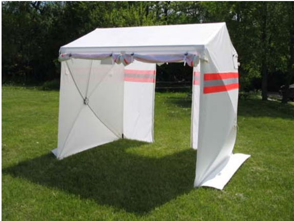
6725TS (vorne große Rolltüre, hinten zentraler Eingang)