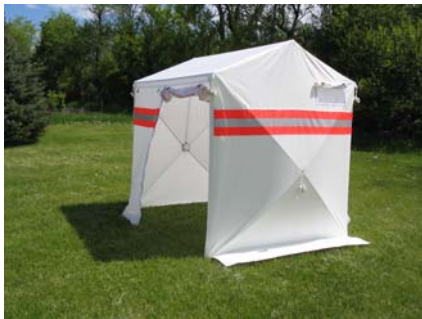
Asymmetrischer Aufbau (Nur 175cm Tiefe bei über 200cm Breite)