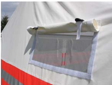
Fenster und Zwangsbelüftung