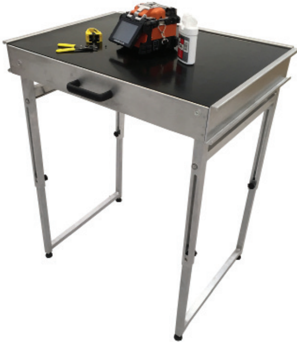
TSO-Netze Montagetisch (mit paarweise höhenverstellbaren Füßen)