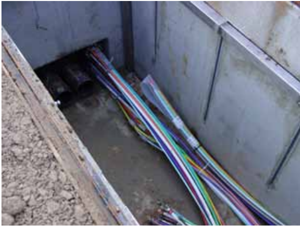
Rohrenden zum Teilnehmer und der Muffe im Schacht