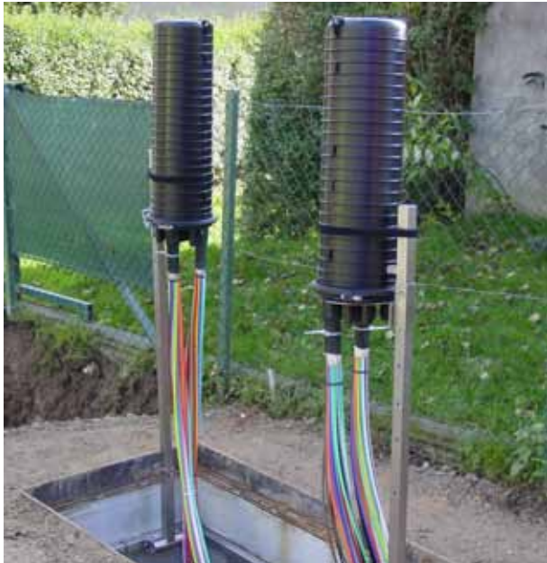
TSO-Netze FTTX Muffen im Einsatz