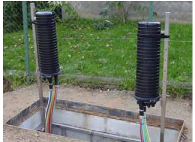
Herausgeklappt zur weiteren Montage