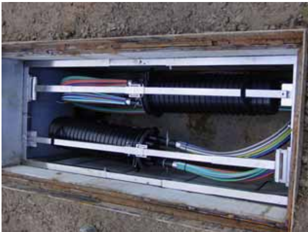
Fertig installiert im Schacht