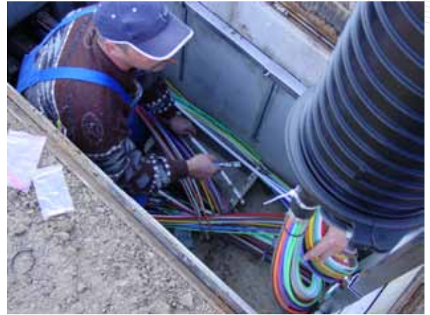
Verbindung der Rohrenden