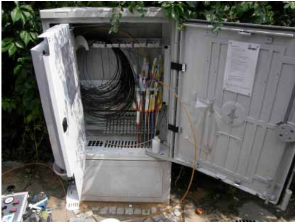
Einblasbereich (Spleißbereich aufgeklappt)