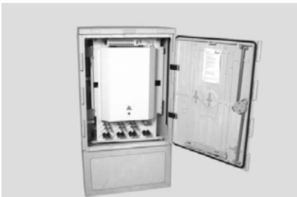
Komplette Lösung mit verschlossenem Spleißbereich