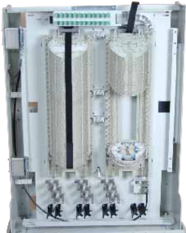
TSO-Netze KVZ 82 FTTX Verteiler (Spleißebene)