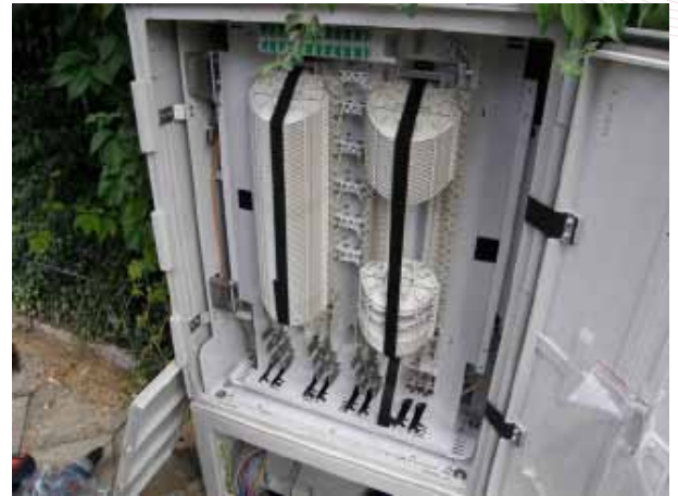
Spleißbereich mit montierten Spleißkassetten