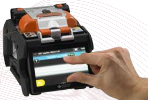
Gestenbasierte Zoom Funktion